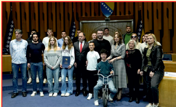
Sa dodjele Šestoaprilske nagrade Grada Sarajeva