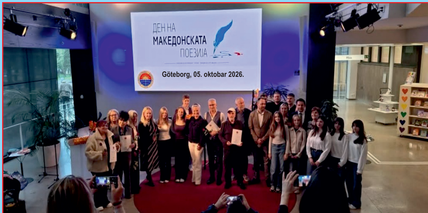
Zajednička fotografija svih učesnika na jubilarnim 35. Danima makedonske poezije

Nedjelja, 5. oktobar 2026. godine, u Statsbiblioteci u Geteborgu, održani su 35. Dani makedonske poezije u Švedskoj.