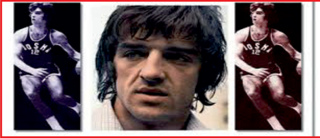
Mirza Delibašić - Kinđe

Kinđe je bio klupski prvak Jugoslavije dva puta, Španije, Evrope i svijeta. S reprezentacijom Jugoslavije bio je prvak Evrope dva puta, svijeta i olimpijski pobjednik. Kao takav je najtrofejnjiji evropski košarkaš svih vremena. Stanovnik je FIBA kuće slavnih, 2008. godine je proglašen za jednog od 35 igrača najzaslužnijih za razvoj košarke u Evropi. Godine 1980. zvanično je proglašen za najboljeg košarkaša Jugoslavije.