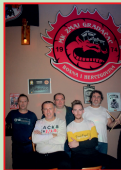
Grupa Panki - Vulkan rock bend